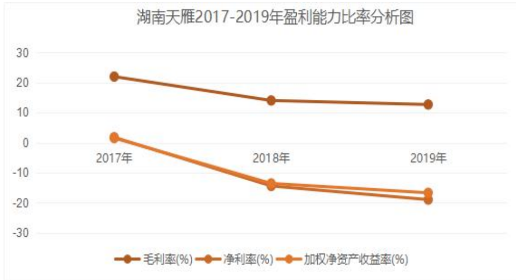
图 1 湖南天雁机械有限责任公司 2017 年-2019 年盈利能力比率分析图

从整体数据变动以及图 1 湖南天雁机械有限责任公司盈利能力趋势分析图来看，整体趋势皆为下降趋向，尤其是净利率从正数值 1.78%降低为 2017 年的-14.42%，在 2019 年继续降低，降低到-18.96%。净利率即净资产收益率，是公司税后利润所占总资产的百分比，是净利润与净资产的比值，大体反映了一个公司股东投资所占利润比的指标，日益降低的净利率值，不仅反映了股市的低迷同时反映了企业近几年产出无法给股东产生利益额。另一个衡量指标可以看到加权净资产收益率，表达公式是报告期净利润与平均净资产的比值，是一个动态的衡量指数，基本变动趋势和净利率相同。纵观 2017 到 2019 年的毛利率数据变化，其在 12%以上波动但总体呈下降趋势，在产品毛利润上还是为正值的，但公司仍需为股东创造更多可视化的利润。