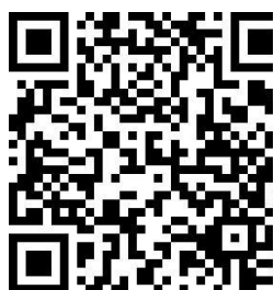
特殊教育 学校教师